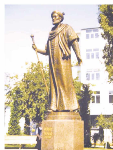
Азербайжан пойтахти Боку шаҳридаги Алишер Навоий ҳайкали

ВАТАНПАРВАРЛИК ТУЙҒУСИ ИНСОННИ БУЮК ИШЛАРГА, МЎЪЖИЗАЛАР ЯРАТИШГА УНДАЙДИ