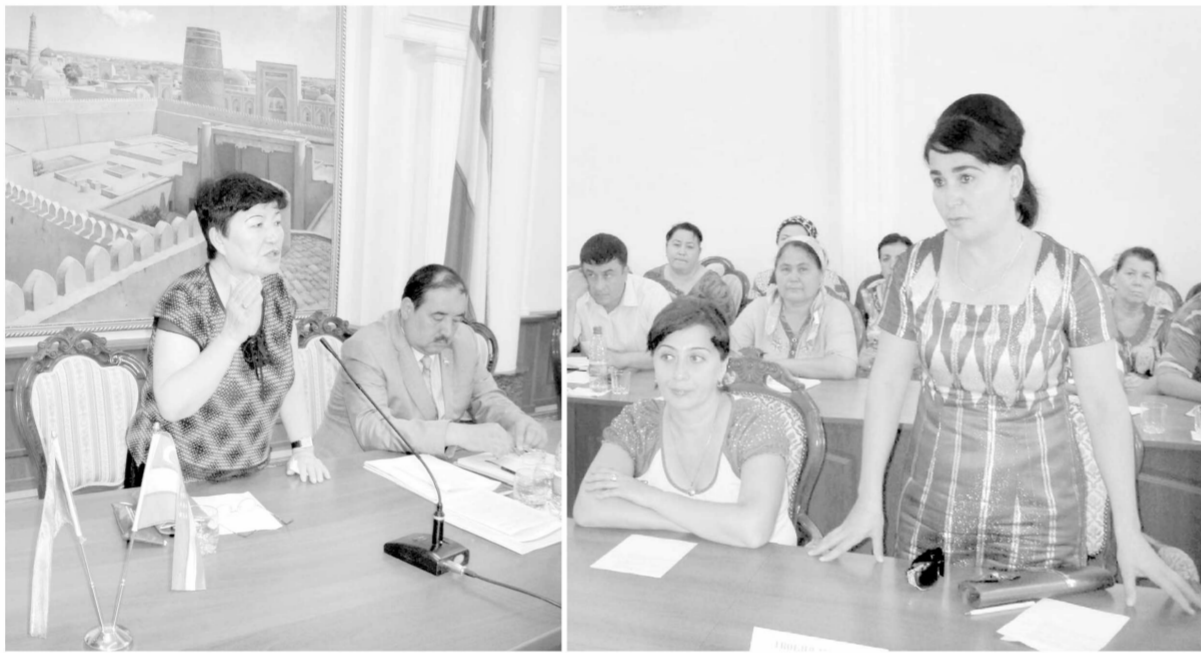
Р.Саъдуллаев олган суратлар.

фаол иштироки билан ижтимоий ҳимоянинг энг синалган усули, яъни одамлар бандлигини таъминлаш, уларнинг ижтимоий фаоллигини оширишга қаратилган «Оилавий тадбиркорлик тўғрисида»ги Қонуннинг қабул қилинганини айтиш жоиз.