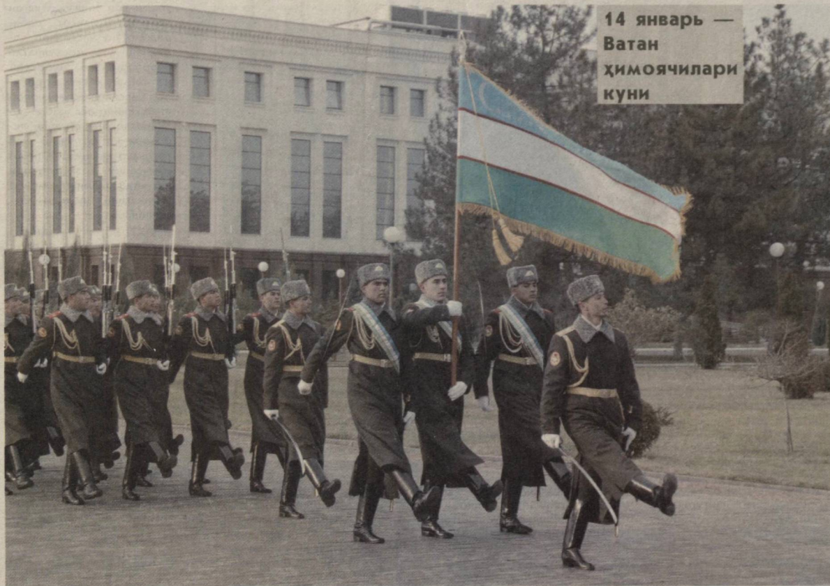
14 январь — Ватан ҳимоячилари куни