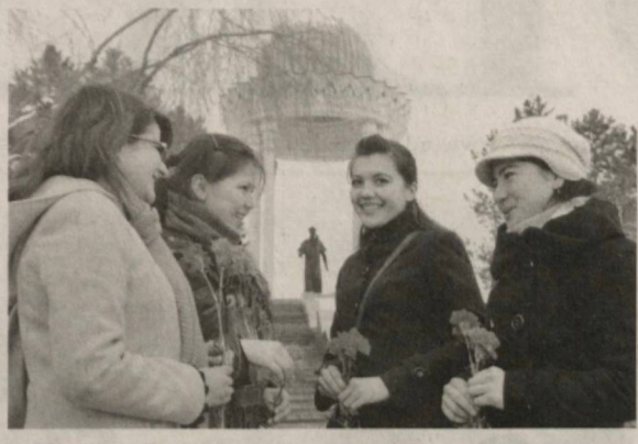
Таҳкамлаш, оилаларни қўллаб-қувватлаш, ота-онани эъзозлаш, ёшларга меҳр ва эътибор кўрсатиш сингари ибратли ишларда ўз ифодасини топмоқда.