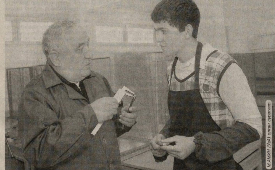
Суратларда: Юнусобод машинаСОЗЛИК касб-хунар коллежи ўқувчилари машгулотларда.