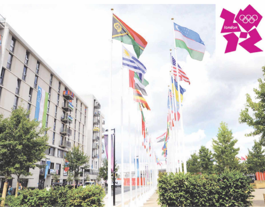
Мусобақад АМИН (Уш) олган суратлар.

Фазлиддин Гойибназаров (60 кг) ўз вазн тоифасида дастлабки учрашувда камерунлик Абдон Мевовига қарши рингга кўтарилди. «Қора кўта»нинг етакчи спортчиси билан кечган бахсда ҳамюртимиз 11:6 ҳисобида ғалаба қозонди. Фазлиддин иккинчи даврада Хосе Рамирес (АҚШ) билан рўбарў келадиган бўлди.