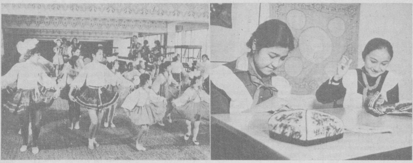
Яқиндагина ўзининг ярим асрлик тўйини нишонлаган В. И. Ленин номи республика пионер ва ўқувчилар саройи шахримиз болаларининг энг севимли масканларидан бири, Сарой янги замонавий бинога қўчиб ўтгандан бўён бу ердаги тўғарақларнинг иши янада жойлашиб кетди. Тўғарақлар...