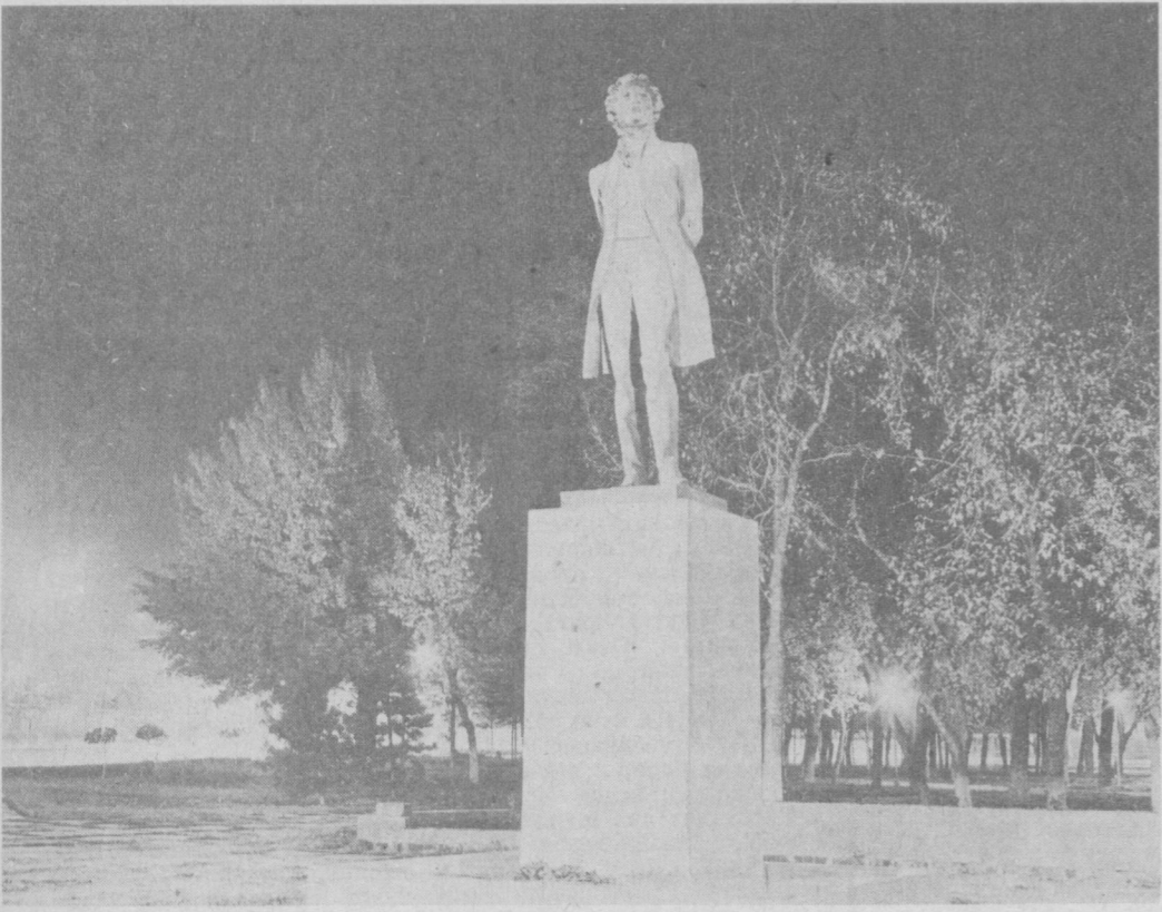
БУГУНГИ ТОШКЕНТ. ПУШКИННОМИДАГИ МАЙДОН.