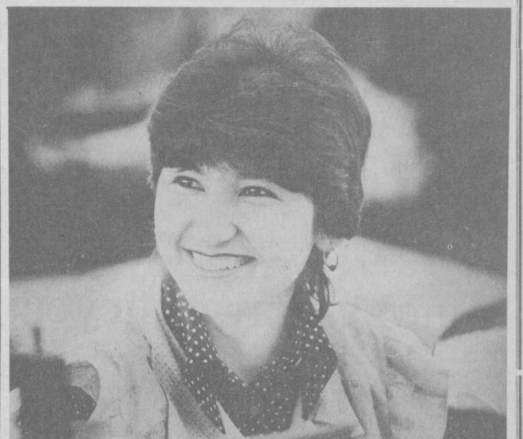
Ўзбекистон Компартиясининг XXI съезди олдиданга қўйган янги вазифалар ҳар бир партия ташкилоти, ҳар бир меҳнат коллективидан, ҳар бир кишидан ишга янгича ёндашишни, унда тўб бурилишлар қилишни ҳалол ва фидокорона меҳнат қилишни талаб этиди. Пойтахтдаги «Қизил тонг» тиву...

Фрунзе район партия комитетида корхона, ташкилот ва муассасалар бошлангич партия ташкилотлари секретарларининг давра столи атрофида учрашуви бўлиб ўтди.