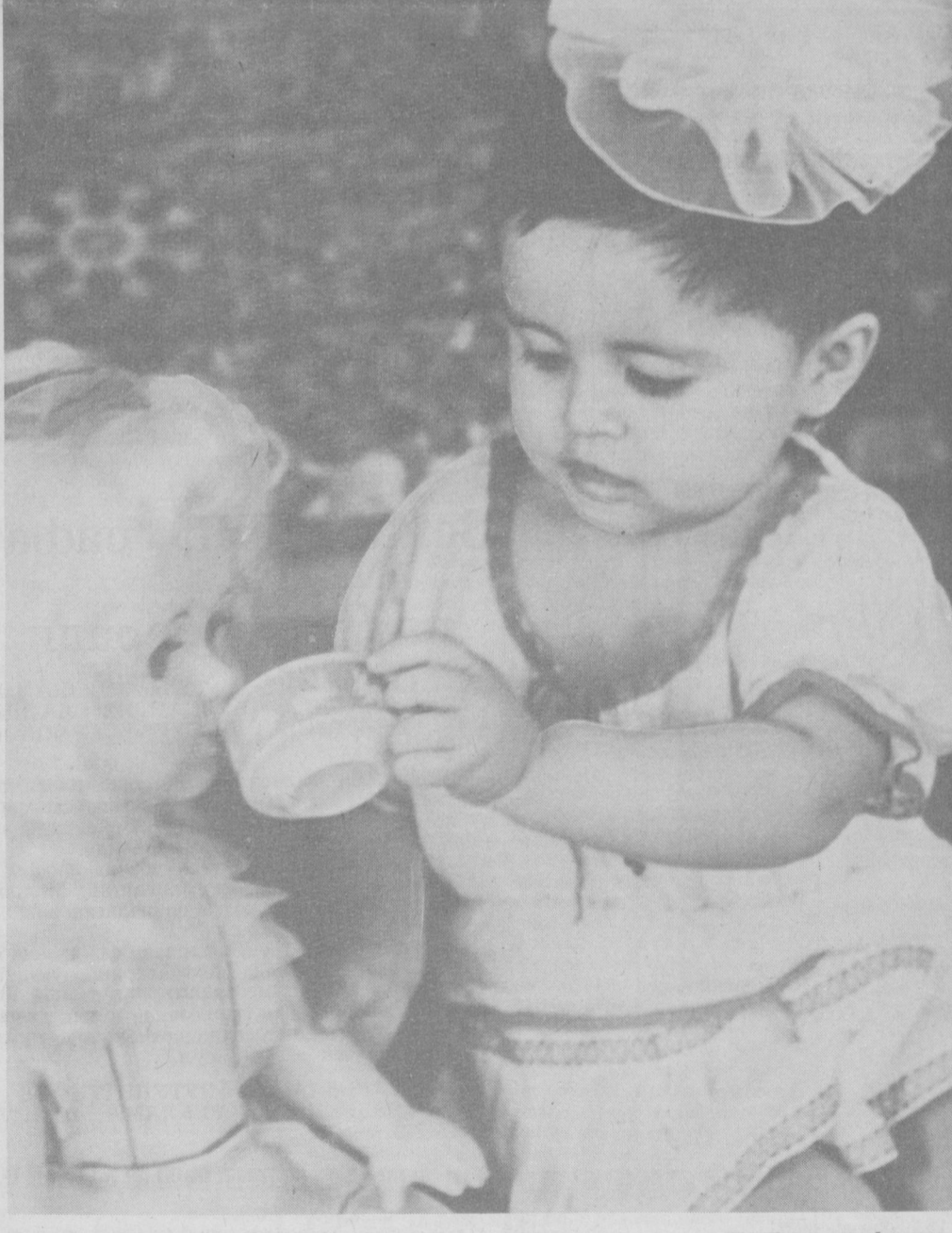
«Чайқаб қолдингми, дўмбоғим».