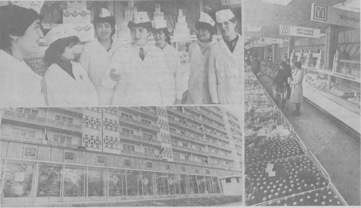
Хамшаҳарлар, сизлар учун