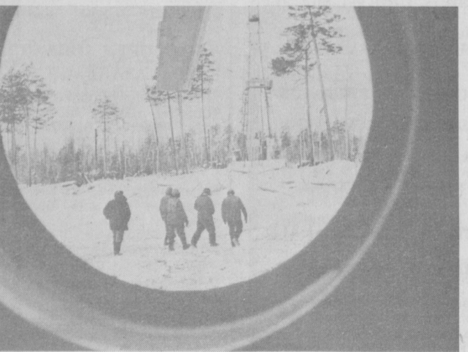
Иркутск областининг Катанг районидаги ер ости фойдаланиш...

Бу ноёб гилам Алишер Навоий номидаги Ўзбекистон ССР Давлат адабиёт музейига тортиқ қилинган эди. У «Хамса»нинг 500 йиллиги муносабати билан яқинда музейнинг «Хамса» залида муносиб ўрин олди.