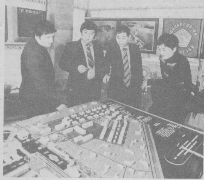
СУРАТДА: архитекторлар гуруҳи маънавият кўздан кечириш...