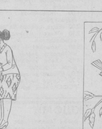
— Ойқон, беш баҳоларим сизга совға.