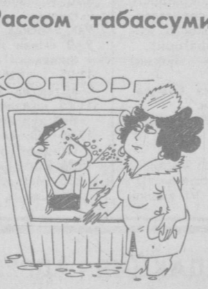
— Ойқон, беш баҳоларим сизга совға.