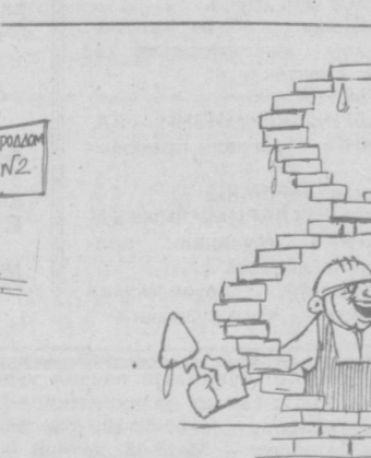
— Кларахон, байрамингиз муборак.