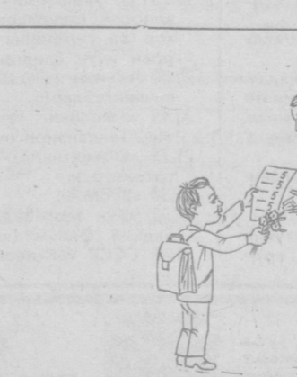
— Сенга бугун гул тақдим этаман.