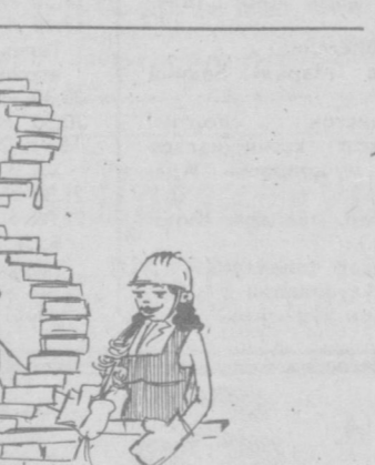
— Дадаси, бугун сиз хизматда, биз иззатда...