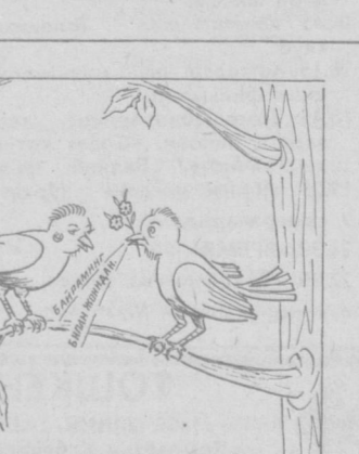
— Сенга бугун гул тақдим этаман.