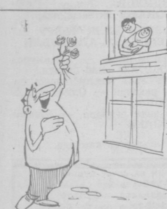
— Дадаси, 8 Мартага сингилчи фарзанд муборак!