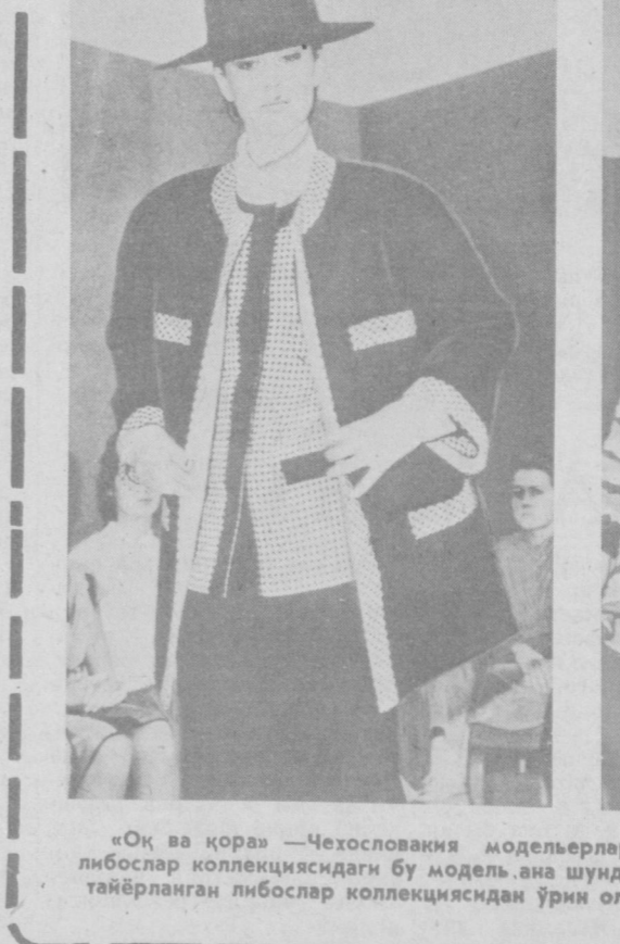
«Оқ ва қора» — Чехословакия модельерлари куз-қиш мавсумига атаб тайёрлабган либослар коллекциясидаги бир модель.

Лондонда чиқадиган «Морнинг стар» газетасининг таърифлари қоршида бир вақтинг ўзиде олға қараб зафарли нуктаси, ҳам шарт майдони бўлди.