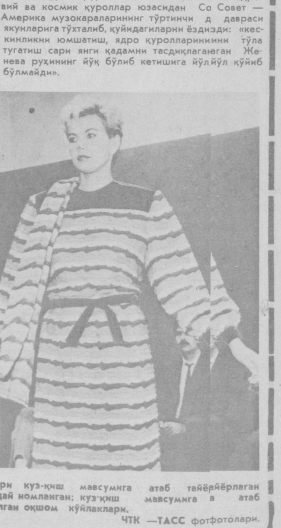
«Оқ ва қора» — Чехословакия модельерлари куз-қиш мавсумига атаб тайёрлабган либослар коллекциясидаги бир модель.

Японияда чиқадиган «Асахи» газетаси ядровий ва космик қуроллар юзасидан Со Совет — Америке музокараларининг тўртинчи д давраси якунларига тўхталиб, куйдагиларни ёздизди: