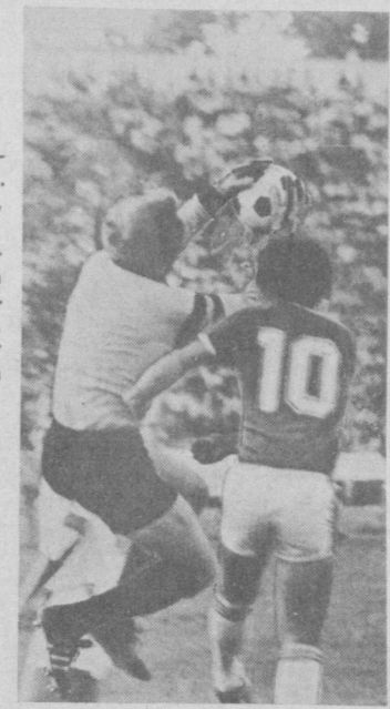
19 ёшли Паулс Фуртени кузатинг... У жаҳон чемпионатида пешқадам бўлади...

ли даражада кучли команда тузишимиз мумкин... Мигель МУНЬОС (62 ёшда, Испания): Бўлуси чемпионатда тўплар нисбати кам бўлади. Бу бизга яхши. Бразилияликлар билан бир гурппада қатнашимиздан хурсандман. Акс ҳолда биз аjoyиб команда билан учрашиш учун камидан энг яхши тўртта команда қаторидан жой олишимизга тўғри келарди... Билли БИНГХЭМ (54 ёшда, Шимолий Ирландия): Мексикага биз жуда кучли командани, тажрибали профессионаллар олиб боряпмиз. У ерда ҳамма умидвор бўлиши мумкин. Рабах СААДЕН (36 ёшда, Жазоир): Биз Шимолий ирландияликлардан кўпроқ чўчиймиз. Чунки бразилияликлар ва испанияликлар футболчи биз учун анча қўлайдир. V ГРУППА Франц БЕНКЕНБАУЭР (40 ёшда, ГФР): Хозирги футболда Пеле бўлмаганидек, маълумиятга эришмайдиган командалар ҳам йўқ. Бу сафарги чемпионат қатнашчилари состави тахминан бир савияда. Омар БОРРАС (52 ёшда, Уругвай): Агар дунёнинг турли чеккаларида ўйнаётган энг кучли