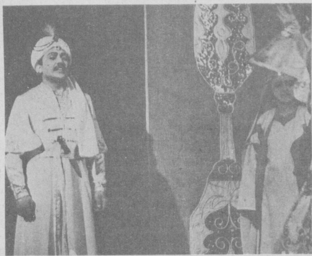
27 март — Халқаро театр куни