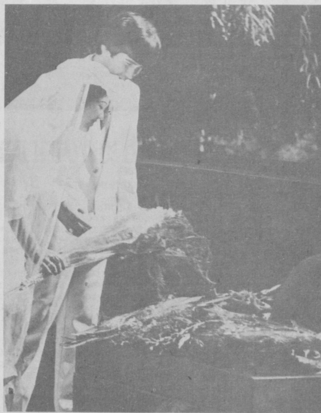
Номмаълум солдат қабрига гулчамбар қўйилмоқда.

(С. М. КИРОВ ТУФИЛГАН КУНИНГ 100 ЙИЛЛИГИГА) I