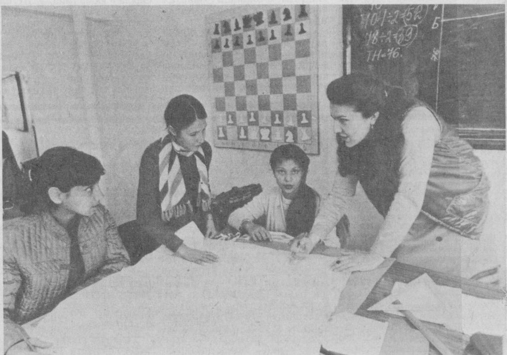
КОБУЛ. Афғонистон пойтахтининг марказий районларидан бири — Даймазонда совет фани ва маданияти уйининг асосий вазиёси фани ва маданияти уйининг замонавий биноси жойлашган. У Совет Иттиқоқининг маблағига Кипр архитектори М. Багила лойиҳаси асосида қурилган. Бу ерда ажойиб заллар, кўрғазмалар хонаси, музика салонлари бўлиб, уларда турли хил тўғараклар, шу жумладан рус тилини ўрганиш курслари ишлмоқда. Совет

Асосий эътибор ўш иккинчи беш йиллик ва унинг биринчи йили ишлаб чиқариш план-топириқлари ва социалистик мажбуриятларини муваффақиятли адо этишга қаратилмоқда. Масалан, халқ назоратчилари бош корпусда