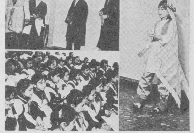
22-мактабда аёлчи ўқувчилар сўети бўлиб ўтди. Ҳамзанинг «Бой ила хизматчи» пьесаси асосида тайёрланган сахна асари томошабинларда яхши таассурот қолдирди.

Сюжети қизиқ воқеалар асосида қурилган мазкур пьеса яқин орада сахна юзини кўради. Уни Ҳушнубоев номи республика театри постановка қилишга киришди.