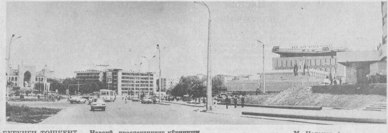
БУГУНГИ ТОШКЕНТ. Навоий проспектининг кўриниши.

Ғолиб чиқиб, Кемеровода 1:0 ҳисобида «Кузбасс» командасига имкониятни бой бергани бутуниттifoқ миқёсида маълум бўлди.