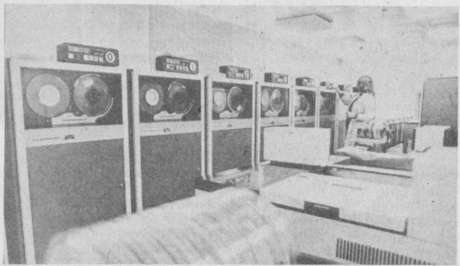
МОСКВА. Халқ хўжалигида электроникадан фойдаланиш Узро Иқтисодий Ердам Кенгашига аҳоли бўлган мамлакатлар иқтисодий йўналишида аҳамият касб этмоқда.

ЧАРЕНЦАВАН (Арманистон ССР). «Армавто» бирлашмасида янги типдаги автопогрузчиклар ишлаб чиқарила бошлади.