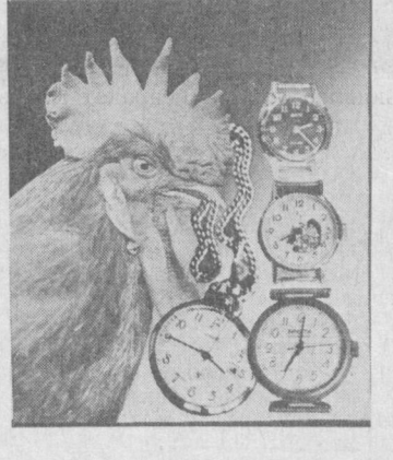
«ТАШКУЛЬТТОРГ» (телефон 91-18-79).

«Союзторгреклама» Бутуниттифоқ бирлашмасининг Ўзбекистон реклама агентлиги (телефон 45-37-27)