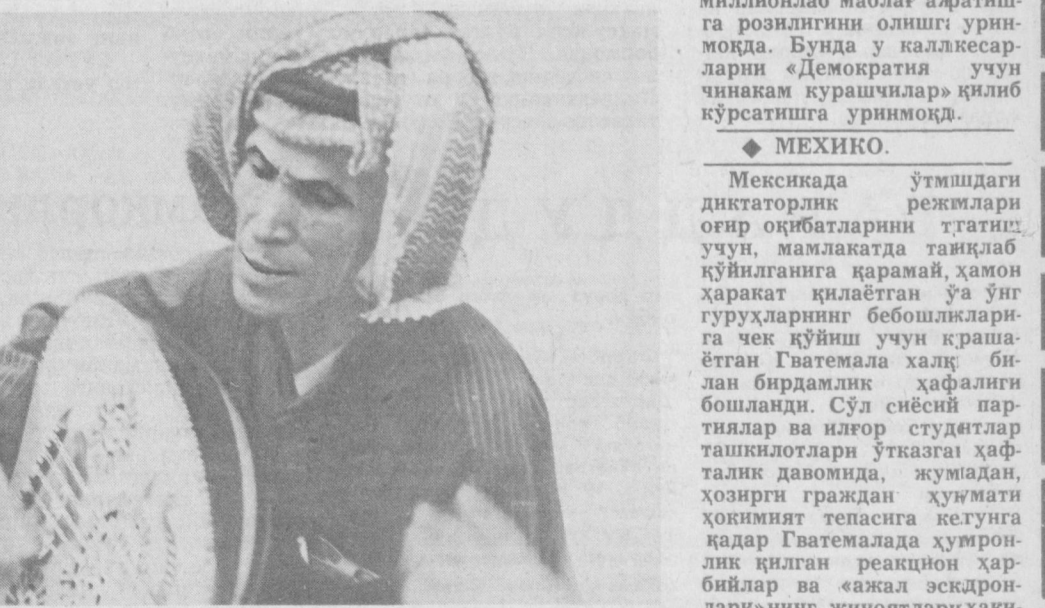
Миллий [ўнганда] ТАСС фотохроникаси.

Мексикада ўтмишдаги диктаторлик режими оғир оқибатларини тгатиш учун, мамлакатда таъқлаб қўйилганга қарамай, ҳамон қурилиш ишлари ўн гуруҳларнинг бешошқарига чек қўйиш учун крашаётган Гватемала халқ билан бирдамлик ҳафалиги бошланди. Сўл сийёсий партиялар ва илгор студентлар ташкилотлари ўтказган ҳафталик давомида, жумадан, ҳозирги граждн хушмати ҳокимият тегасига келунга қадар Гватемалада хушронлик қилган реакция ҳарбийлари ва «ажал эскдронлари»нинг жиноятлари ҳақида ҳижоа қилувчи фоқургазма ташкил этиш сўзда тутилган.