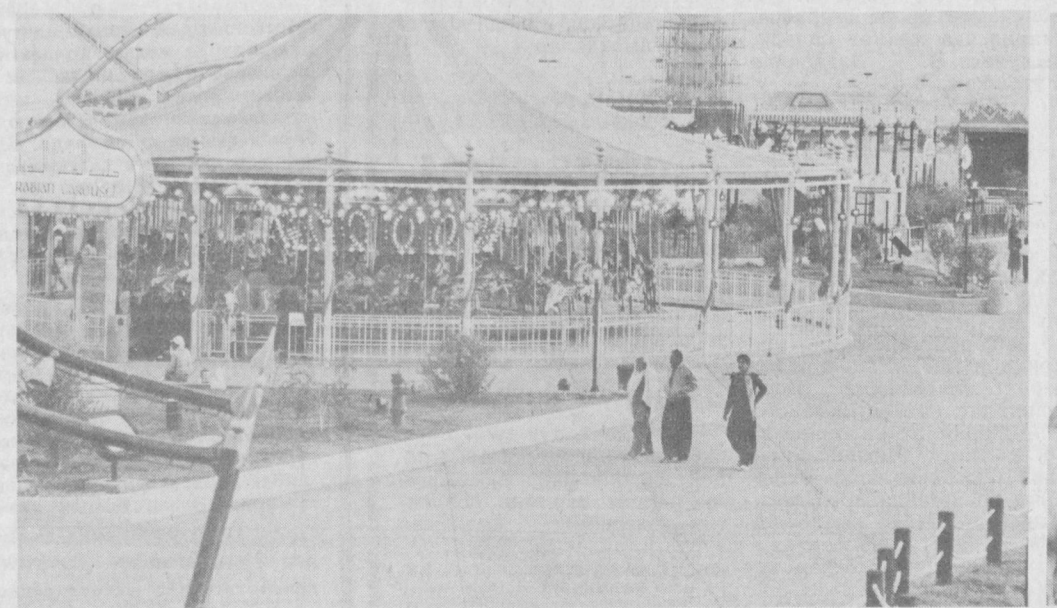
ОБЪЕКТИВДА — КУВАЙТ. СУРАТЛАРДА: Кувайтнинг пойтахтида [чапда] бунёд этилган йирик туристик комплексни кўриб турибсиз. Миллий [ўнганда]