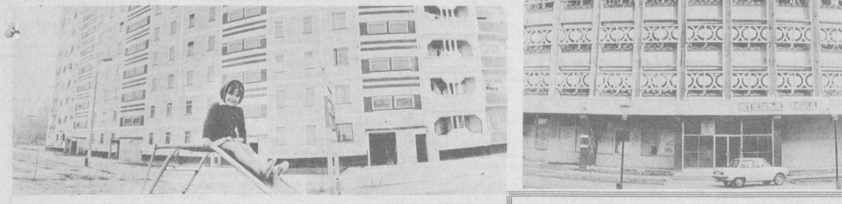
СУРАТЛАРДА: районнинг бугунги жамоли—13-кварталда бунёд этилган бу уйларга район аҳолиси кўчиб киришди. Маиший хизмат уйи аҳолининг мушкулларини осон қилмоқда.

Районнинг Фарҳод ва Х. Турсунқулов кўчалари муюлишида осмонўпар уй-жой биноси учун қурилиш майдони ажратилди. Шундай қилиб районда биринчи марта 16 қаватдан иборат бино қурилишига тараддуд қилина бошлади. Янги бино лойиҳаси «Ташгипрогор» лойиҳа институтининг 3-устонасида архитектор В. Л. Спивак бошличилида тайёр-ланмоқда. Булаёқ иморатнинг умумий уй-жой майдони 6776 квадрат метрдан иборат бўлиб, 124 оилани ўз бағрига олади. Унинг 2, 3, 4 хонали квартираларида оилалар учун яхши ша-роит яратилади. Бионинг биринчи қаватида чойхона бўлиб, шарбатлар, су-влар билан савдо қилувчи дўкон ҳам ишлайди. Келгуси йили қурилиши бошланадиган бу бино икки йил ичида битказили-ши мўлжалланмоқда.