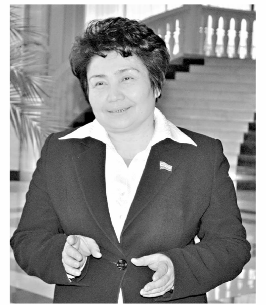
Дилбар ХОЛИҚОВА, Олий Мажлис Қонунчили палатаси депутаты, ЎЗХДП фракцияси аъзоси

ИСТИҚЛОЛ ЙИЛЛАРИДА ЭРИШИЛГАН ЮТУҚЛАР МЕВАСИНИ ҲАР БИРИМИЗ ЎЗ ҲАЁТИМИЗДА, ОИЛАМИЗДА, ФАРЗАНДАЛАРИМИЗ КАМОЛИДА Кўриб, БИЛИБ ТУРИМИЗ.