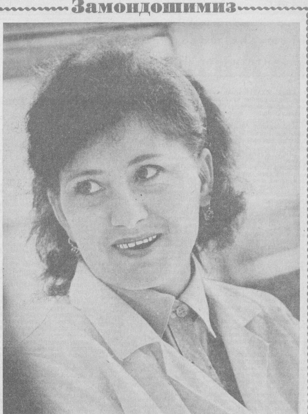
Касбга меҳр. Бу сўзини ўз ичига қўйиб, кўп қўйди. Бироқ эътиборсизлик билан тингларди.

баларни кенг ёйиш, мавжуд камчиликларга барҳам бериш зарурлигини таъкидладилар. Бу борада партия комитети кенг ошқоралиқни таъминлаш, съезд белгилаб берган вазифаларни изчил амалга оширишга, идеологик, сиёсий-тарбиявий ишларнинг барча воситаларидан унумли фойдаланиш, бу муҳим масалани барча ҳар партия ташкилотлари ўз ишларининг марказига қўйишлари юзасидан бир қатор тадбирлар белгилади.