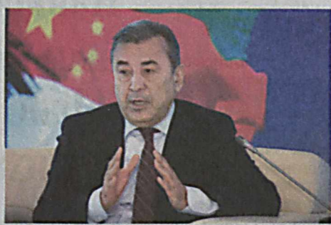
решения афганского кризиса. Стороны еще раз поддержали инициативу запуска прямых переговоров между

— Ташкентская конференция стала важным событием на глобальном уровне. Проведенные встречи показали, что весь мир встревожен ситуацией в Афганистане. На форуме разработан новый политический подход к прекращению многолетней войны в многострадальной стране. 21 государство, соседние страны, две крупные международные организации подписали Ташкентскую декларацию, обозначившую четкую «дорожную карту»