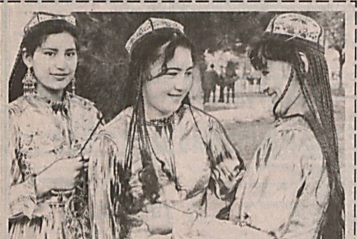
Ило, аёл борки — бу ҳаёт дилдор, Яйнаман — тул расмин чиниб ҳайла. Ҳеч қурса, яна дуст, ҳар кун бир бор — Бир оғиз ширин сўз айткил айла!!

УТРИЛАР. Тошкент вилоятининг ДАНБ йул — папурул хизмати ноирлар томонидан «Тошкент-Бекобод» йулида кетилган «ИАЗ-695» автобуси туҳматлиқ текширилганда унда 64 қоп шакар, 800 донна хужик совуни, 240 килограмм маргарин ҳамда 60 килограмм саринг