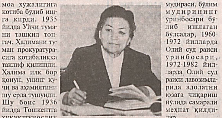
Ҳалима Муҳидинованинг портретига чизилар

мудираси, бўлим мудирининг уринбосари бўлиб ишлаган бўлсалар, 1960-1972 йилларда Олий суд раиси уринбосари, 1972-1982 йилларда Олий суд раиси лавозимларида адолатни юзага чиқариш йўлида самарали меҳнат қилди.