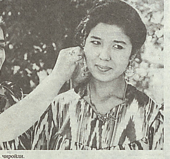
Дўтожаҳон, бадкоқларнинг мунча чиройли.