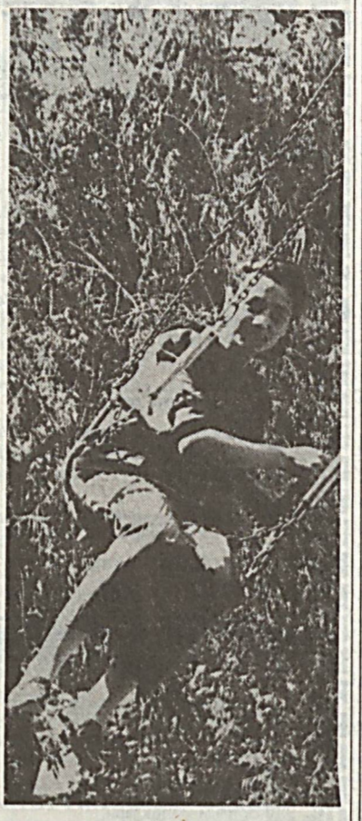
Халифкада шомол каби учган қиз, Опуларни буауларни кўчага қиз...