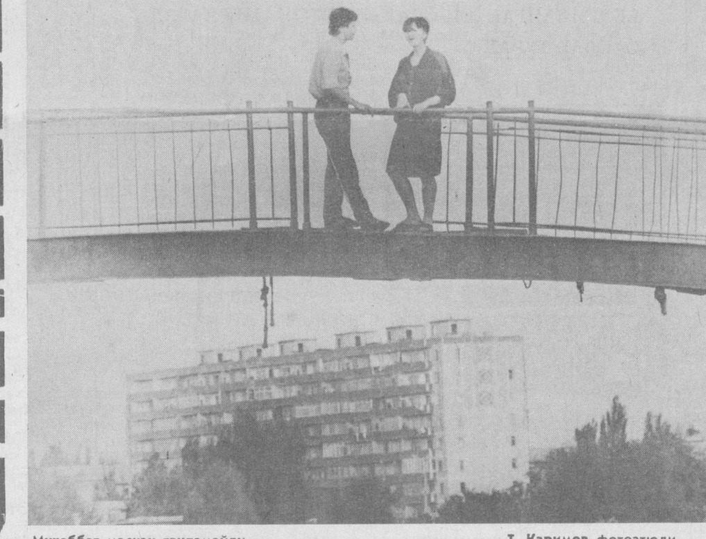
Муҳаббат маскан танламайди...

чиққан. Русча помидор сўзи француз тилидан ўтган бўлиб «помме»-олма, «д, ор» олтин, яъни олтин олма маъносини билдиради. «Какао» сўзи Никарагуадан ўтган бўлиб, ерли халқ тилида дархат ҳам, меваси ҳам какао дейилади. У Европада ичкилик сифатида 16 асрдан бери маълумдир.