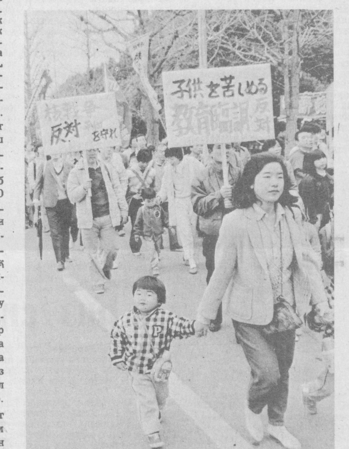
Яқинда Токиода бўлиб ўтган оммавий намойиш қатнашчилари консерваторлар ҳукуматидан япон ороларнинг ядро қуроллари масканига айлантириш сибастидан воз кечишини ва халқ эҳтимики учун зарур маблағларни ажратилиш талаб қилдилар.

◆ КОБУЛ. Алдениб кўпорувчилик фаолиятига жалб этилган тобора кўплай арғонлар апрель инқилоби тўғрисидаги ҳақиқатни тушуниб етгач, халқ ҳокимияти томонига ўтишмоқда. Базар агентлигининг хабар беришича, илгари Босмачилар билан ҳамкорлик қилган афғон аҳолисида 514 киши киролини ташлаб, ўз ихтиёри билан Жавзжон вилояти хавфсизлик қўчаларига таслим бўлди. Улар бундан бундан халқ ва апрель революцияси галабаларини ҳимоя қилмади, деб ҳокимиятга ваъда бердилар. Ана шу вилоятда аксинчиликчи гуруҳлардан бирининг қуролланган тўдаси ихтиёрий равишда ҳукумат томонига ўтган эди.