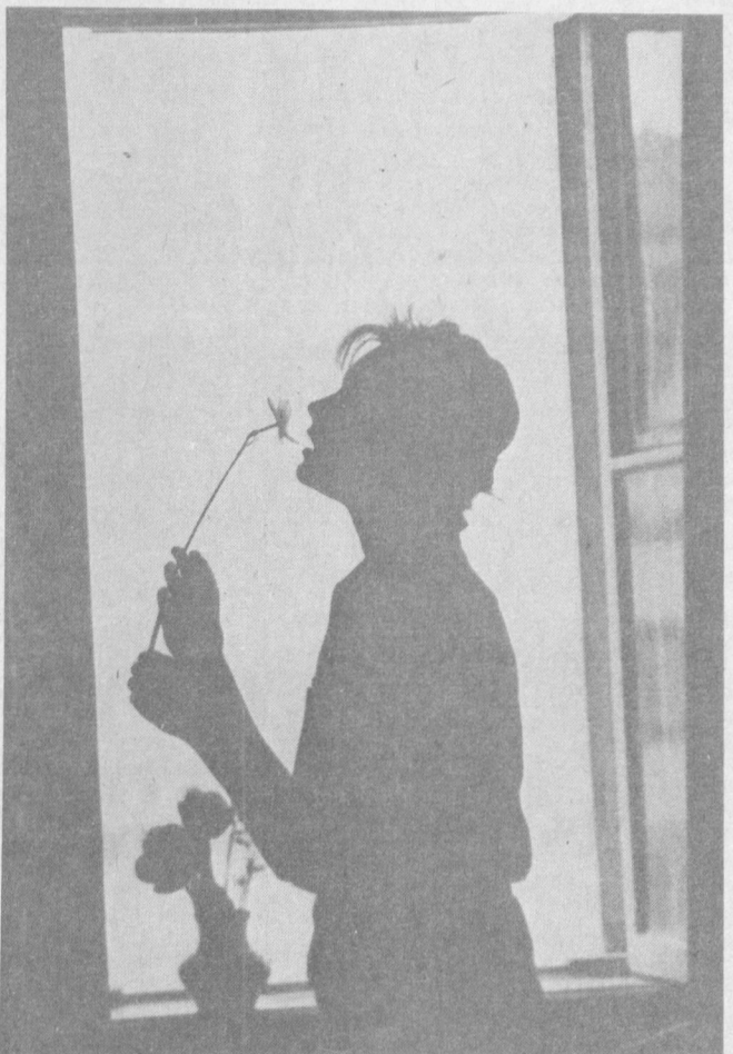
Гул ҳаёт, гулгун ҳаёт....

Бу мушқсимон ҳайвонни ов қилиш умуман тақиқланган. Уни Ўзбекистонда, Зомин, Чотқол, Ҳисор қўриқхоналарида муҳофаза қилинмоқда ва илмий-тадқиқотлар олиб борилмоқда. Қ. ОЛЛАБЕРГАНОВ, биология фанлари кандидати.