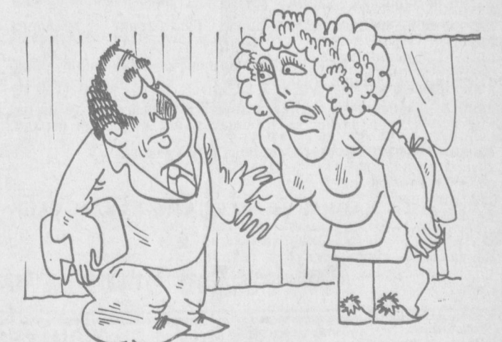
— Менга 6-арн-бир, кирмасам кирмайман, аммо ишга нега келмадинг дейишса билиб қўй, ўзинг жавоб бера-сан...