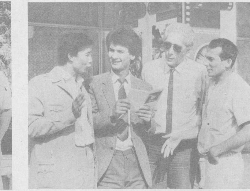
Тэнто, К. Сэйдиро, Т. Такахиро, К. Рэндо. Иккинчи суратда эса СССР, Аргентина, Лаос киносанъаткорлари