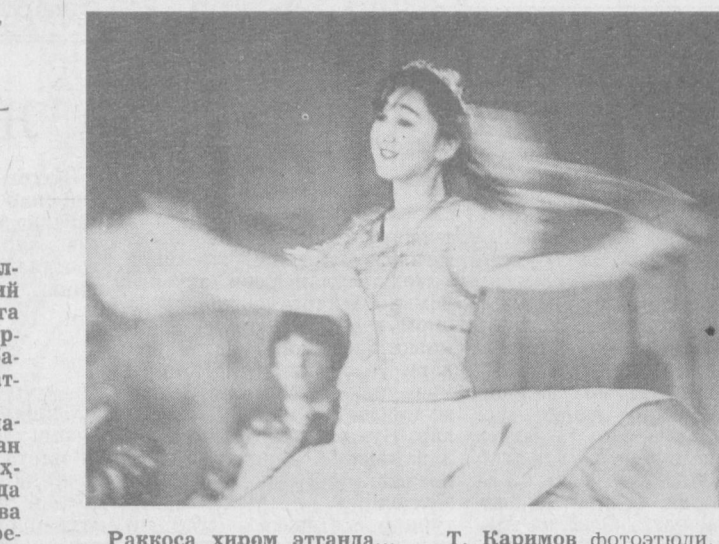
Рақдоса хиром этганда... Т. Каримов фототўди.

Фильм венгер кинодраматурги Жужи Селези билан тожик ёзувчиси Леонид Махкамов сценарийин асосда яратилган. Иозеф Кш ва Валерий Ахадон фильмга режиссерлик қилишмоқда. Янги картина академик Вамбернинг фойдали тақдирини, унинг Урта Осиё, Эрон бўйлаб сафарлари ҳақида ҳикоя қилиш билан бира, халқлар дўстлиги ва ҳамкорлиги илм-фан, маданиятни ривожлантиришга қанчалик кўмаклашганлиги тўғрисида ҳам ҳикоя қилади.