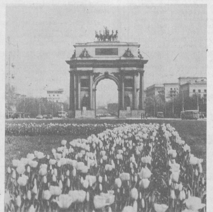
МОСКВА. Победа майдонидagi Триумфаль пештоқ олдида.