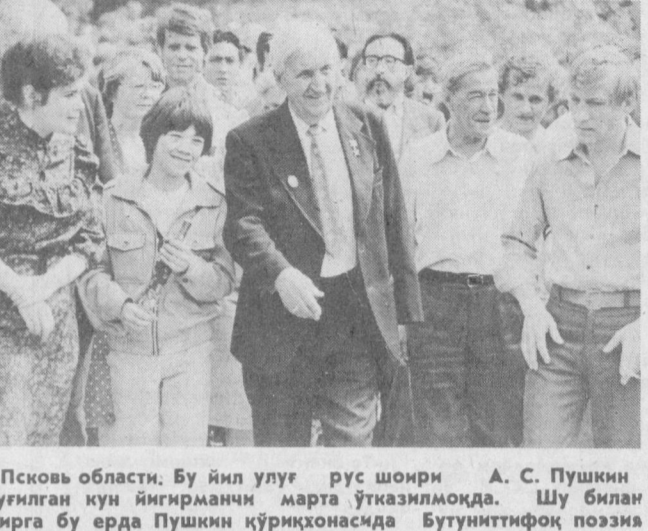
Псков области. Бу йил улуг рус шоири А. С. Пушкин туғилган кун ийгиридан марта ўтказилмоқда. Шу билан бирга бу ерда Пушкин кўриқхонасида Бутуниттифоқ поэзия байрами кенг нишонланмоқда.

Пушкин ижодида эл муҳаб- бати бунга ёрқин мисоллар. Шукур ҚУРБОНОВ.