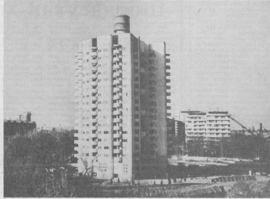
Кейинги йилларда Космонавтар проспекти янада чирой очиб кетди. Бу ерда қатор маданий-маиший объектлар билан бир қаторда, мезморчилик жиҳатидан ўзинга хос бўлган оригинал турар жой бинолари ҳам қад кўтармоқда. Ушбу суратда нигоҳингизга ҳавола этилаётган 16 қаватли экспериментал уй фирмизнинг далилидир. Яқинда қурувчилар макур уйни ҳамшаҳарларимизга ҳада этдилар. СўРАТДА: шахримизда ягона кўринишга эга бўлган экспериментал уйнинг ташқи кўриниши.