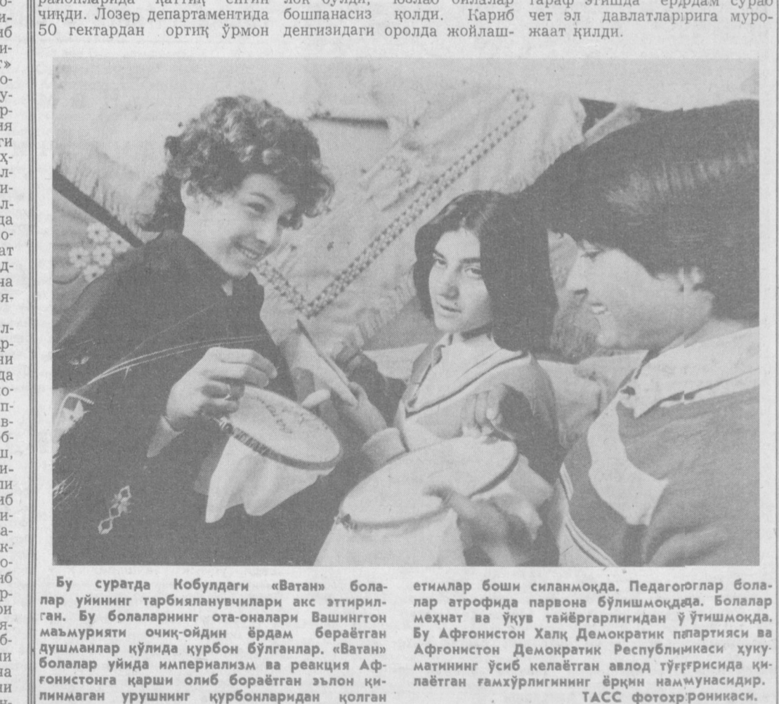
Бу суратда Кобулдаги «Ватан» болалар уйининг тарбиялувлари акс эттирилган. Бу болаларнинг ота-оналари Вашингтон маъмурияти очик-ойдин ёрдам бераётган душманлар қўлида қурбон бўлганлар. «Ватан» болалар уйида имперализм ва реакция Афғонистонга қарши олиб бораётган эълон қилинмаган урушнинг қурбонларидан қолган етимлар боши силанмоқда. Педагоглар болалар атрафида пврона бўлишмоқда. Болалар меҳнат ва ўқув тайёрланишдан ўтишмоқда. Бу Афғонистон Халқ Демократик партияси ва Афғонистон Демократик Республикасини ҳуку матининг ўсиб келаятган авлод тўғрисида қилаётган галмўрлигининг ёрқин намунасикидир.

● ГАВАНА Ямайка жала оқибатида кучли сув тошқини рўй берди. Натияжада 50 киши ҳалок бўлди, юзлаб оилалар бепанаснас қолди. Қариб бешнасан оролда жойлашган