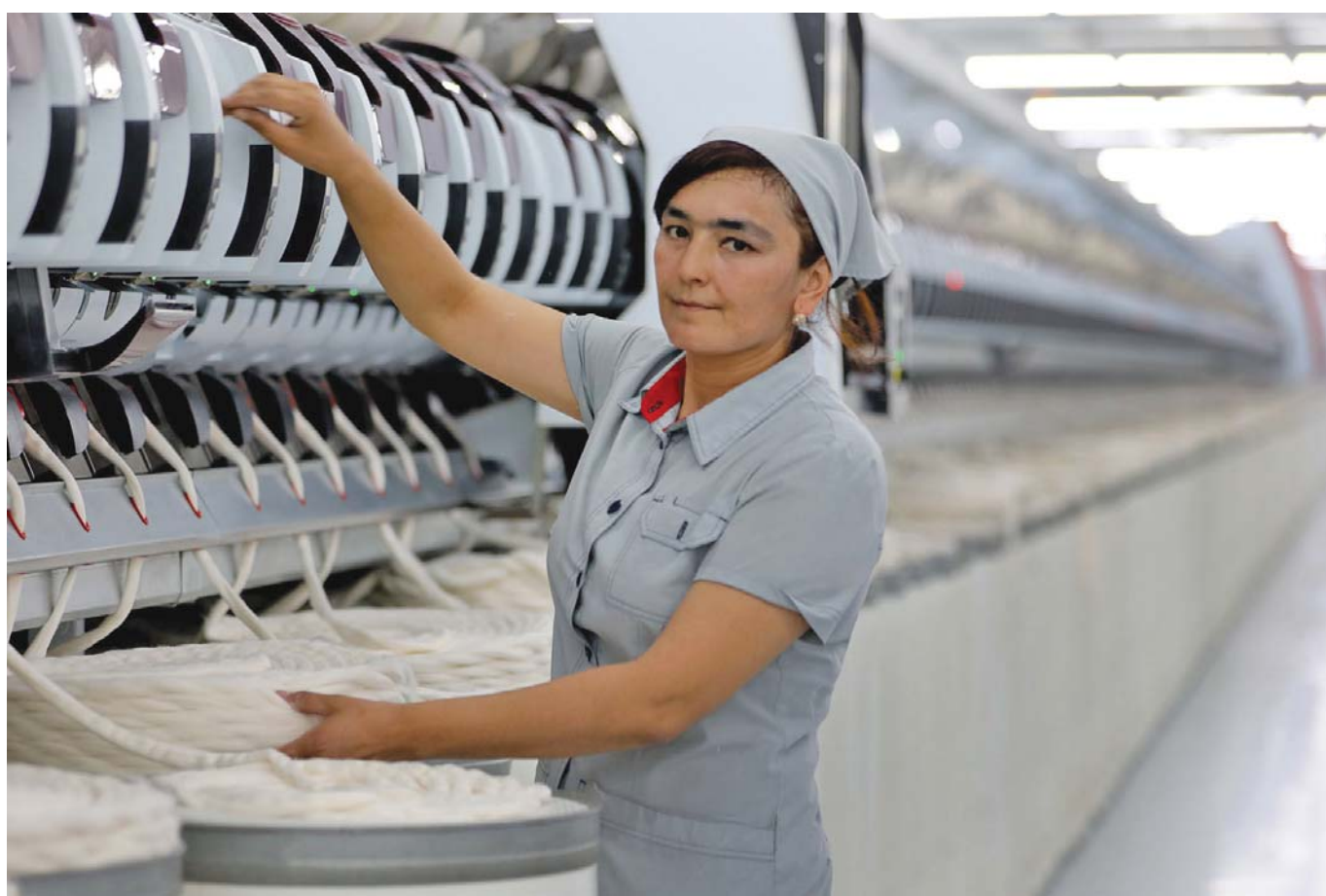
Ҳаҷми содироти солони корхонаи воқеъ дар ноҳияи Тўрақўргони вилояти Намангон – «FT textile group», ки аз наҳи пахта қалоба истеҳсол менамояд, 25 миллион доллар ИМА-ро ташкил медиҳад. Дар корхонае, ки ба ивази 35 миллион доллар инвеститсия бунёд гардидааст, 270 нафар кор мекунанд.

Барои ҳодимони корхона шароити хуби қорӣ фароҳам оварда шудааст.