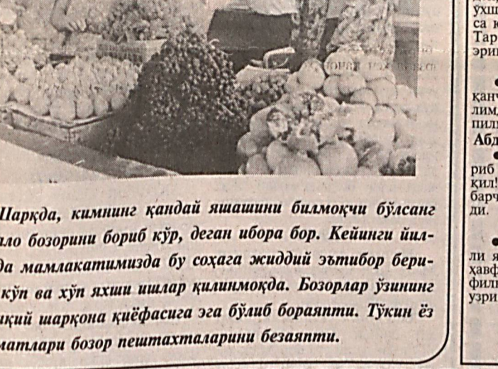
Шарқда, қимнинг қандай яшашини биламоқчи бўлсанг аввало бозорини бориб кўр, деган ибора бор. Кейинги йил- ларда мамлакатимизда бу соҳага жиддий эътибор бери- либ кўп ва хўп яхши ишлар қилинмоқда. Бозорлар ўзининг ҳақиқий шарқона қиёфасига эга бўлиб бораёпти. Тўқин ёз неъматлари бозор пештахталарини безаяпти.