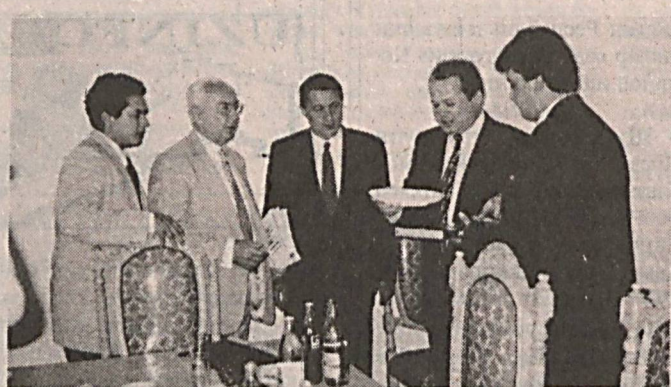
СУРАТДА: Европа тикланиш ва тараққиёт банки президенти жаноб Жак Де Лазарер (чапдан иккинчи) «Парвина-банк»ка эсдалик дастхатини топшираётган пайт.

Бир неча ой муқаддам Самарқандда таъриф буғун Европа тараққиёт ва тикланиш банки президенти жаноб Жак Де Лазарер «Парвина банк» фаолияти билан танишиш чоғида ушбу мамулятига яшролмади ва у: «Браво — Парвина», дея унинг фаолиятига юксак баҳо берди. Чунки бу ердаги аниқлик, тежорлик, мукамаллик ва умуман мижозлар кунлиги «овлаш» булган иштиёқ Европада банк маданиятини тартиб этувчи меҳмонда ҳуқур таассурот қолдирган эди.