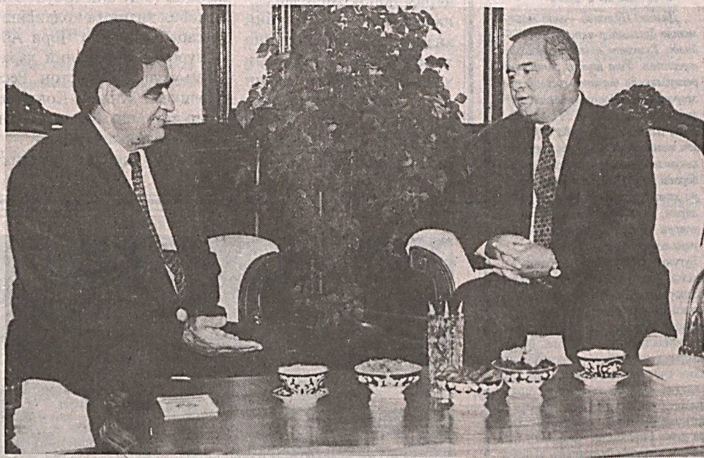
корликнинг келажаги пурок эканига ишонч билдирди. Ойдин Азимбеков қардош ўзбек ва озарбойжон халқлари дўстлигини янада мустаҳкамлаш учун хизмат қилишдек хайрли вазифани адо этиш йўлида имкони борича сайёҳаракат курсатишини билдирди. Ишонч ерликларини тошқириб маросимда Ўзбекистон Республикаси ташқи ишлар вазири Абдулазиз Комилов иштирок этди.

Ўзбекистон Президенти Имом Каримовга 5 сентябрь кuni Озарбойжон Республикасининг мамлакатимиздаги Факултода ва Мухтор элчиси Ойдин Азимбеков ҳам ишонч ерлигини тошқирди. Ўзбекистон билан Озарбойжон ўртасидаги алоқалар, халқларимизнинг азалий дўстлиги ҳақида ҳар қанча гапирса оз. Мамлакатларимиз мустақилликка эришганидан кейин бу муносабатлар янги тус олди. Айниқса, Президент Имом Каримовнинг шу йил баҳорда Озарбойжонга қилган ташрифидан кейин икки давлат ўртасидаги дўстлик ва ҳамкорлик муносабатлари янги босқичга кўтарилди. Мамлакатимиз раҳбари ишонч ерлигини қабул қилиб олар экан, элчининг мастулиятлиги, лекин хайрли вазифани бажаришида муваффақият тилаб, мамлакатларимиз ўртасидаги ҳам