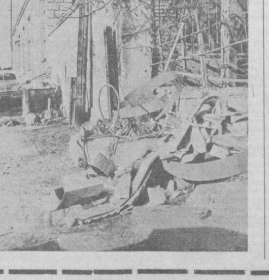
Биз бу ерда бошқачароқ аҳволга дуч келдик. Яъни, сиз суратда кўриб турган аҳволга. Бунинг қаранг — даста гул кўтариб келган еш оталар бу манзарани кўриб гулини қўлтирига беркийтиб четлаб ўтади. Шу тугруқхонада дунёга келган йиғитчага «Сен шу бинодо тугилгансан деб кўрсатмиса хавф бўлиб кетади. «Мен шу ерда тугилдимми!» дея ранжиши ҳам турган гап. Бу «манзар» — кимларнингдир этиборсизлигининг оқибати, албатта. Тугруқхона маъмурияти ҳам, Собир Раҳимов район «Автодормехбаза»сидегилар ҳам бундай аҳолини кўриб ажэбланишлари мумкин. Еки аллақачонлардан буён ажэбланимай қўйишганмикин!.. С. САЛОҲИДИНОВ, Х. Шодиев фотоси.