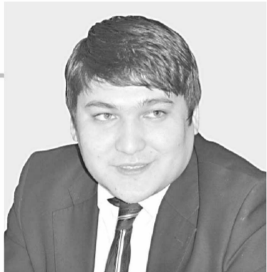
— Бугун вояга етаетган ёшлар эртага оила куради, ота-она бўлади. Янги оила қандай бўлиши бу ёшларнинг ҳуқуқий-сиёсий билими ва маънавиятига боғлиқ. Улар оила муқаддас кўрган экани, унинг жамият олдидидаги бурчи ва масъулиятини қанча чуқур англасса, оила шунча мустақам бўлади. Ҳозир сир эмас, айрим ёш оилалар турли сабаблар билан ажралиб кетиш

«Истиқбол» ёшлар қаноти бу борада қатор янги лойиҳалар устида ишлапти. Бунда кўпроқ депутат, ҳуқуқшунос ва обрўли инсонлар билан ҳамкорликка таянамиз. Ёшларнинг сиёсий-ҳуқуқий билими, маънавий оламни шакллантиришда сиёсий ўқувлар таъсирчанлигини оширишга ҳам эътибор қаратиш зарур, деб ўйлайман. Биз «Истиқбол» ёшлар қаноти фаоллари тенгдошларимиз кайфияти, муаммоларни бошқалардан ахшироқ билими. Шу боис кўпроқ тақлиф ва ташаббуслар билан чиқишимиз керак.