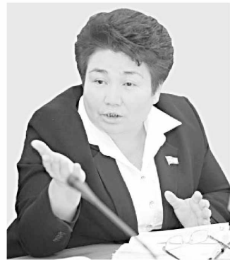
Дилбар ХОЛИҚОВА, Олий Мажлис Қонунчилик палатаси депутати, ЎзХДП фракцияси аъзоси

Ушбу масала бўйича Қонунчилик палатасининг Ахборот ва коммуникация технологиялари масалалари кўмитаси аъзоси Дилбар ХОЛИҚОВАнинг фикр-мулоҳазалари билан қизиқдик.