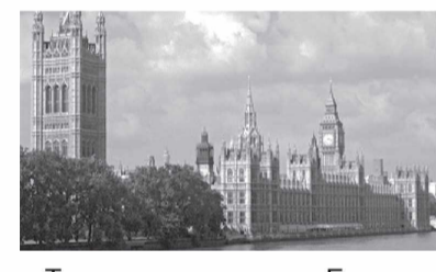
Тарихдан маълумки, Елизавета II 1952 йили отаси қирол Ге-

Ўзгартирилди Яқинда Буюк Британия қироличаси Елизавета II ҳукмронлигининг 60 йиллиги мамлакатда кенг нишонланди. Аян шун юбилей муносабати билан Лондондаги машҳур Westminster минора соати «Биг Бен» қиролича Елизавета II шарафига расман «Елизавета минораси» деб ўзгартирилди.