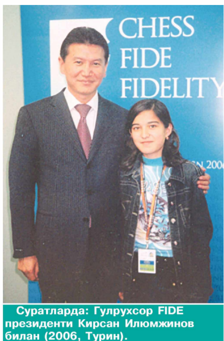
Суратларда: Гулрухсор FIDE президенти Кирсан Илжумзинов билан (2006, Турин).