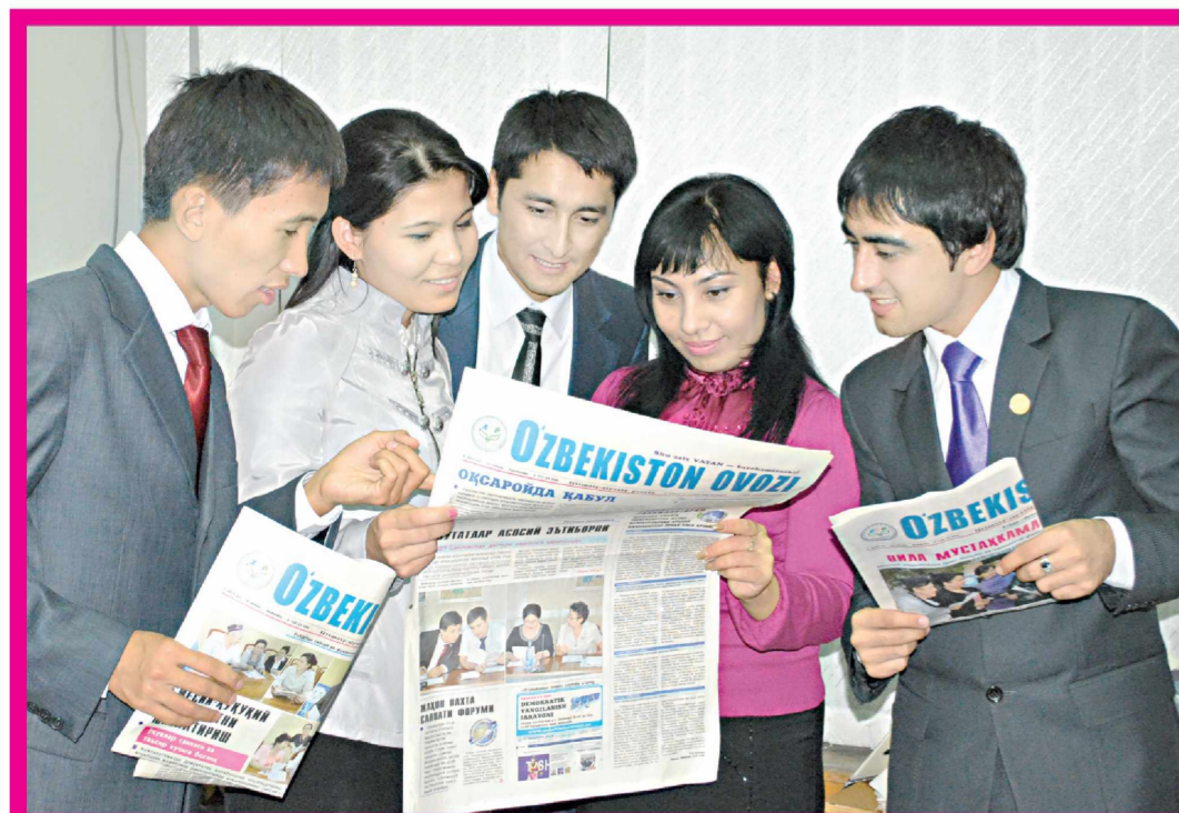
Суратда: «Истиқбол» ёшлар қаноти етакчилари.