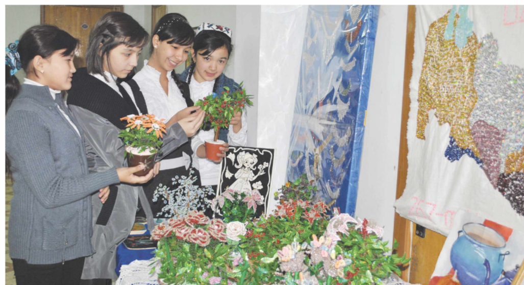
Мурожаат 3ИЕ олган сурат.

маҳалла ва таълим муассасаларида фаолият кўрсатаётган «Ораста қизлар» тўғрақлари муҳим аҳамиятга эга бўлмоқда.