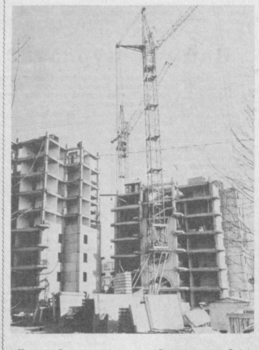
Хамза районидagi янги микрорайонларда кенг қўлама турар жой, маданий-маиший бинолар қад кўтарилди. СУРАТДА: янги микрорайон қурилишида.

В. КОЖЕДУБ, «Ташинжстрой» трести партия комитети секретари.