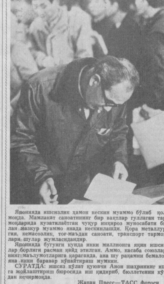
Японияда ишсанлик ҳамон кескин муаммо бўлиб қолмоқда. Мамлакат саноатининг бир вақтлар тулган тармоқларида қулатилган чўқур инқироз муносабати билан мазкур муаммо янада кескинлашди. Қора металлургия, немасозлик, тоғ-мадан саноати, транспорт тармоқлари шумар жумласидандир. Японияда бугунги кунда икки миллионга яқин ишсизлар борлиги расман йўйд этилган. Аммо, касоба союзларнинг маълумотларига қараганда, ана шу рақамни бемалол яна икки баравар кўпайтириш мумкин. СУРАТДА: ишсиз пўлат қувоччи Анон шахрининг ишга жўрлаштириш бюросида иш қидириб, бюллетенни қўздан кеиришмоқда.