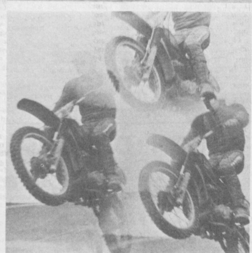
Тезлик, тезлик ва яна тезлик.