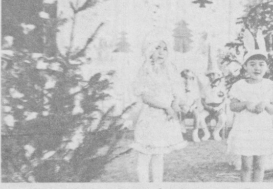
УРТА ЧИРЧИҚ районидagi «Коммунизм» колхозининг «Гўзал» болалар бoғчаси тарбиячилари кичик кўчаларининг ҳар бир кунини мазмунли ўтишига катта эътибор бермоқдалар. Яқинда бу ерда ўтказилган Арча байрам ҳам болаларга катта завқ бағишлади. Суратда: Арча байрамидан лавҳалар.