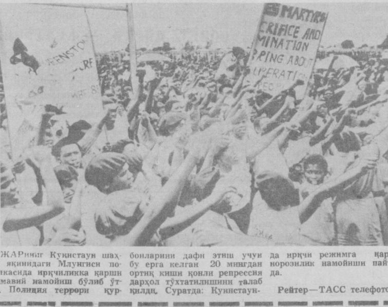
ЖАРНИНГ ҚУНИСТАУН шаҳри яқиндаги Млунгисси по-сёлкасида ирқчилар қарши оммавий намойиш бўлиб ўтди. Полияя террори кў-

Пиночетнинг Фарб банклари билан қалитс битимлари натижасида мамлакатнинг ташқи қарзи 23 миллиард долларга етди ва бу аҳоли, жон бошига ҳисоблаганда дунёда энг катта қарзидир. Муताхасссларнинг фикрича, иқтисодидagi ҳозирги аҳвол сақланиб турганидан бўлса, ташқи қарзининг миқдори яқин уч йил ичида Чили яқин миллий маҳсулотни қиймагига тенглашиб қолади. Ташқи қарзининг бир қисмини ва унинг процентини тўлаш учун ўтган йили режим экспортдан тўлашнинг 60 процент-