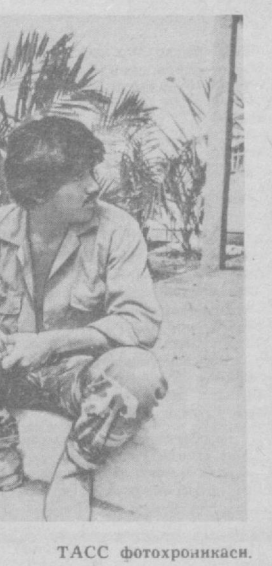
● НИКАРАГУА. Революциянинг ёш ҳимоячилари.

● СОФИЯ. ССРга тикувчилик махсулотларини етказиб бераётган Софидаги «Витория» заводи коллектив КППС XXVII съезди шарафига оширилган мажбурият олади. Бу ерда совет савдо марказлари бюротларини бажариш учун ички резервалардан фойдаланиш ҳисобига эркинлар ва аёллар кийим-кечаклари ишлаб чиқаришни қўйатиришга қарор қилинди. Мукобиль планга мувофиқ бу йил ССРга 66 мингта эркинлар қўйлаги, 50 мингта шима, 30 мингта костюм, 20 мингта плащ юборилди.