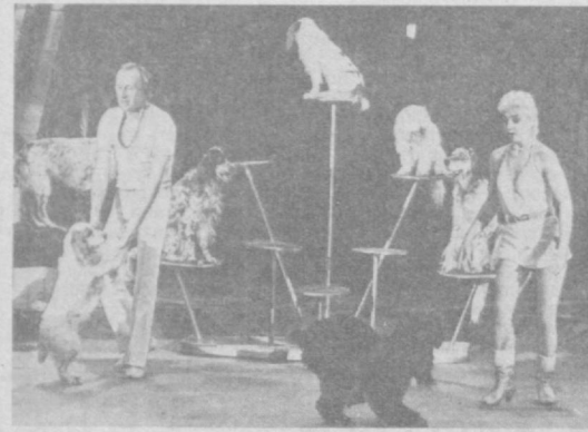
ШУ кунларда Тошкент давлат циркида совет цирки усталарининг гастроллари...