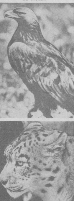
Суратларда: Чотқол бургути; тўқай йўлбарси.