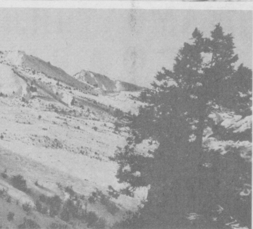
Чайковичи, Львов области.