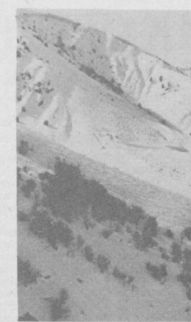
ДОРИВОР УСИМЛИКЛАР КўПАЙСИН

◆ ТОҒ АДРЛАРИ ҚИШ УЙҚУ-СИДА.