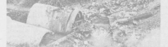
СУРАТДА: Қамаринсо кўчасидаги қаровсиз аҳволда қолган ариқнинг кўрениши.

Ҳаммамиз биланими, турар жой массивлари, болалар боғ-чалари, умумий овқатланиш муассасалари, касалхоналар бинола-рида озиқ-овқат қолдиқлари учун контейнерлар мавжуд. Бундан мақсад озиқ-овқат қолдиқлари чўқачилик комплекси учун ўз ва-қтида олиб кетилиши керак. Лекин контейнерлар ўз вақтида олиб кетилмаяпти. Жумладан, Марказ—17.18 микрорайонларидаги 4, 28, 29, 32, 34, 106, 78-болалар боғчаларида йиғилган озиқ-овқат қолдиқлари бир неча ҳафта туриб қолиб, пашшаларнинг кўпайи-шига сабаб бўляпти. Бу хилдаги антиқа кўренишлар «Ташподо-овошчига қарашли 24, 19, 10, 8 ва 18-магазинлар атрофларида ҳам бор. Бу ерлардан шундоқина ўтиб кетиш қийин. Қолаверса уй ва маҳалла комитетлари, санитария милицияси, дезинфектор-лар, корхона, муассаса ва ташкилотларнинг раҳбарлари ўзимиз ва болаларимиз соғлиги билан боғлиқ бўлган бу муҳим масалага нега етарли эътибор беришмаяпти! Ана шунга ҳайронмиз.