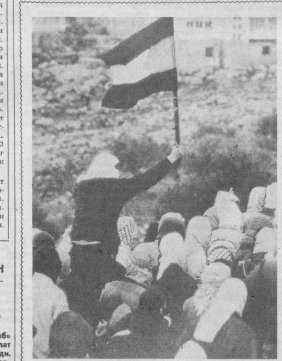
СУРАТДА: Исроилга қарши намоийида иштирок этган фалястинликлар Йордан дарёсининг Фарбий соқилида.

«Венсеремос» радиостанциясининг хабар қилишича, июль ойида партизандар ҳарбий соқчилар ва армия хом машиналарини йўлга 23 та пистирма қўйиб, уларнинг 10 тасини яқсон этдилар.