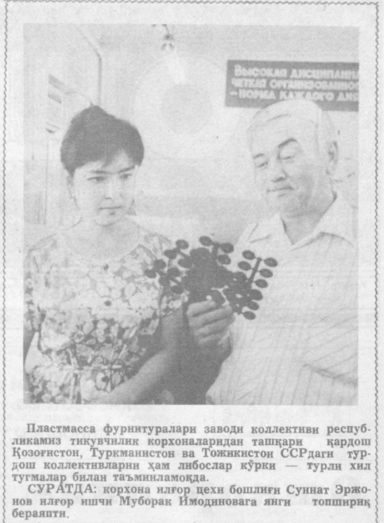
Пластмасса фурнитуралари заводи коллективи республика...