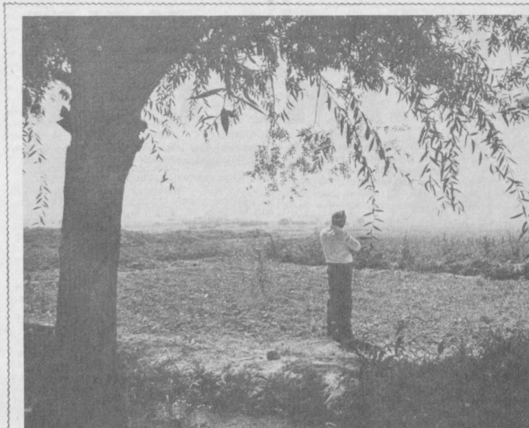
Она табиат қўйида.