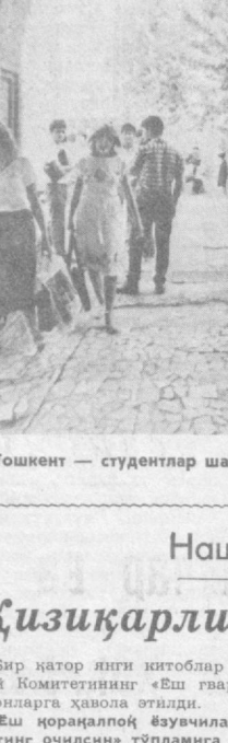
Тошкент — студентлар шахри.

16.00 Болалар учун фильмлар. 16.25 «Эхтиёт бўлинг, илонлар». Бадий фильм. («Эзбекифильм»). 1-серия. 17.30 Табиатушнослик. Узбекистонда куз. 18.05 Янгиликлар. 18.15 «Ешлик» студияси кўрсатади. 19.15 «Халқаро сивбатнинг муҳим воқеалари». 20.00 «Ахборот» (рус.). 20.15 Долзарб интервю. 20.30 «Ахборот». 20.55 «Кўшиқларда севгим садоси». Музикали программа. 21.30 Москва. «Время». 22.05 Москва. «Қайта қуриш прожектори». 22.15 Ш. Бошбеков. «Емир хотин». М. Горький номида Фарғона область музикали драма ва комедия театрининг спектакли. 00.15 Кўрсатувлар программаси.