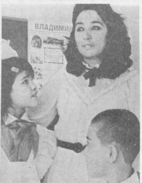
Ўқитувчи — им-фан анёкори, табаррук инсон.

Бугунги кунда Тошкент аgraт жихозланган қонақхонада 50 нафар соғломлаштириш группаси аъзолари шугулланишди.