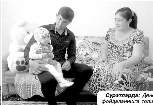
Суратларда: Денов туманидаги «Хитоян» маҳалласида фойдаланишга топширилган янги уй-жойлардан лавҳалар.